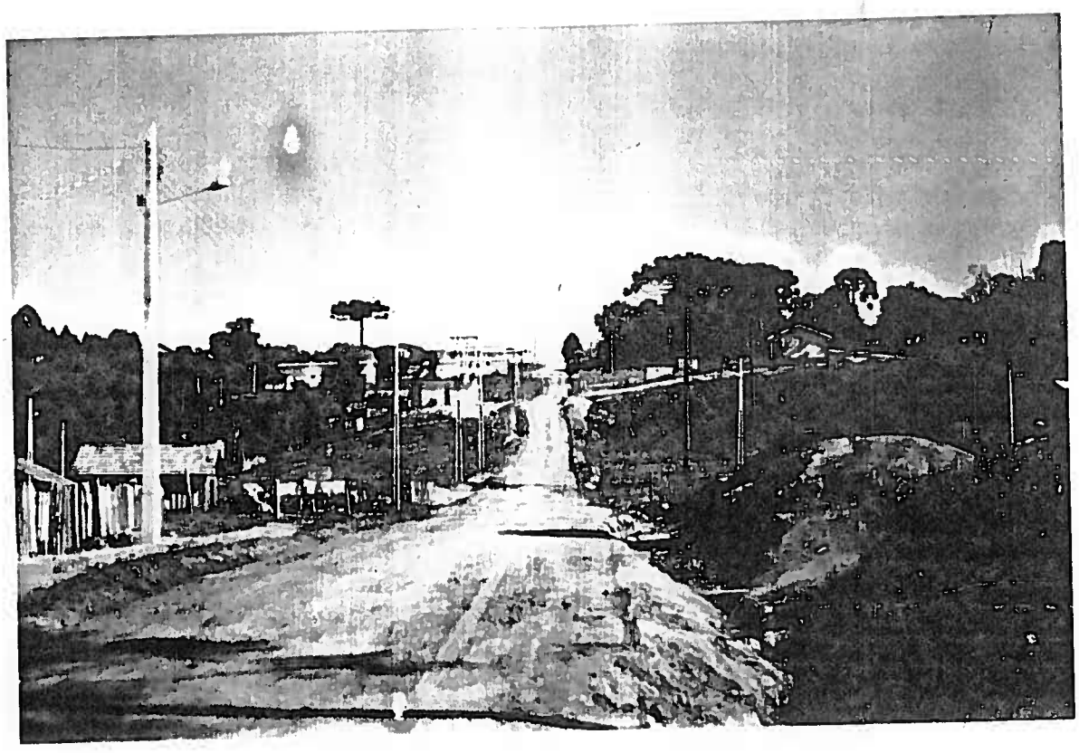
Foto 1 - Loteamento recente em área que exige cuidado com a erosão.

Quando apresentam declividades médias, como é o caso da foto 1, e que tem ocupação recente, há de se ter cuidado com o início de processos erosivos.