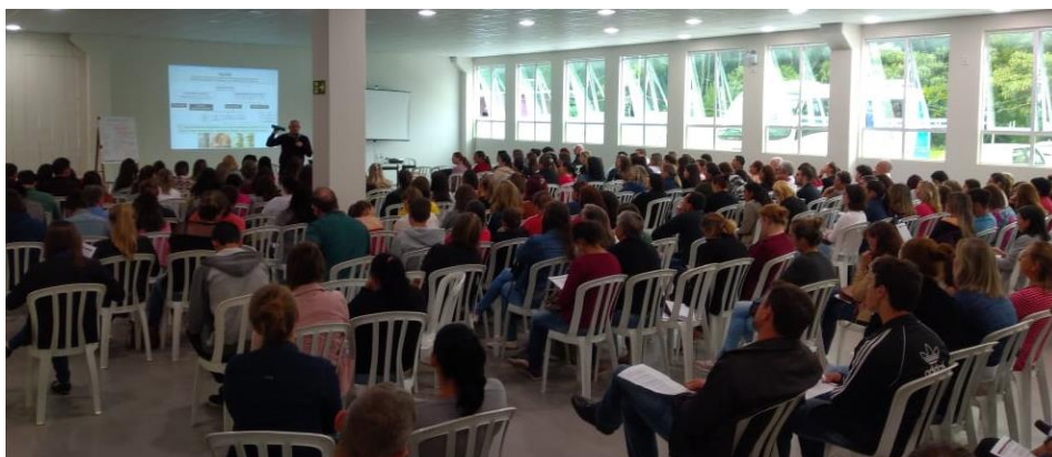
Estratificação de risco do idoso