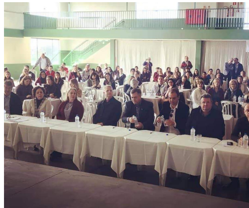
Workshop de Abertura