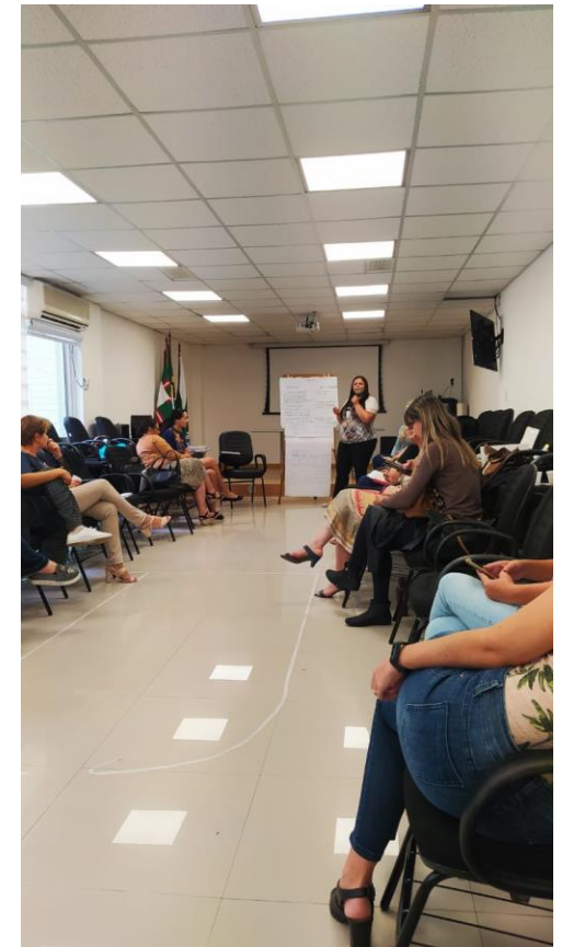
Oficina de Metodologias Ativas