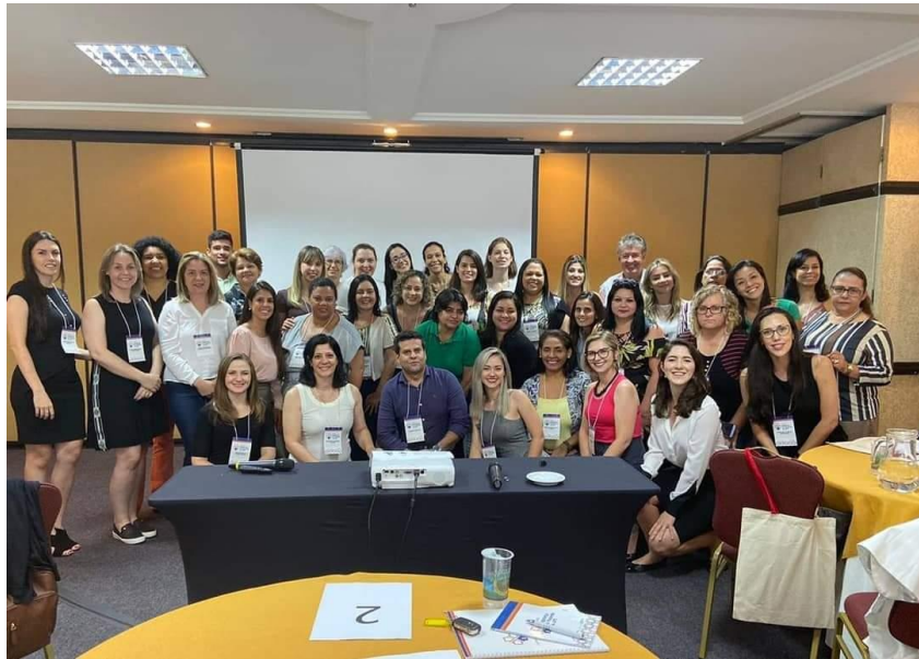
Segurança do paciente na Atenção Primária à Saúde