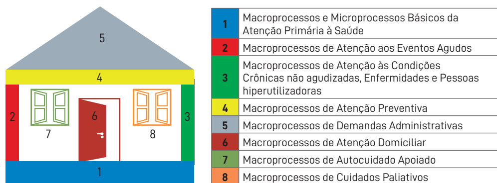
Figura 1. A construção social da Atenção Primária.

Aí também geralmente atuam as ações de vigilância sanitária, no controle de bens, produtos e serviços que oferecem riscos à saúde da população, como alimentos, produtos de limpeza, cosméticos e medicamentos. Realizam também a fiscalização de serviços de interesse da saúde, como escolas, hospitais, clubes, academias, parques e centros comerciais, e ainda inspecionam os processos produtivos que podem pôr em risco e causar danos ao trabalhador e ao meio ambiente.