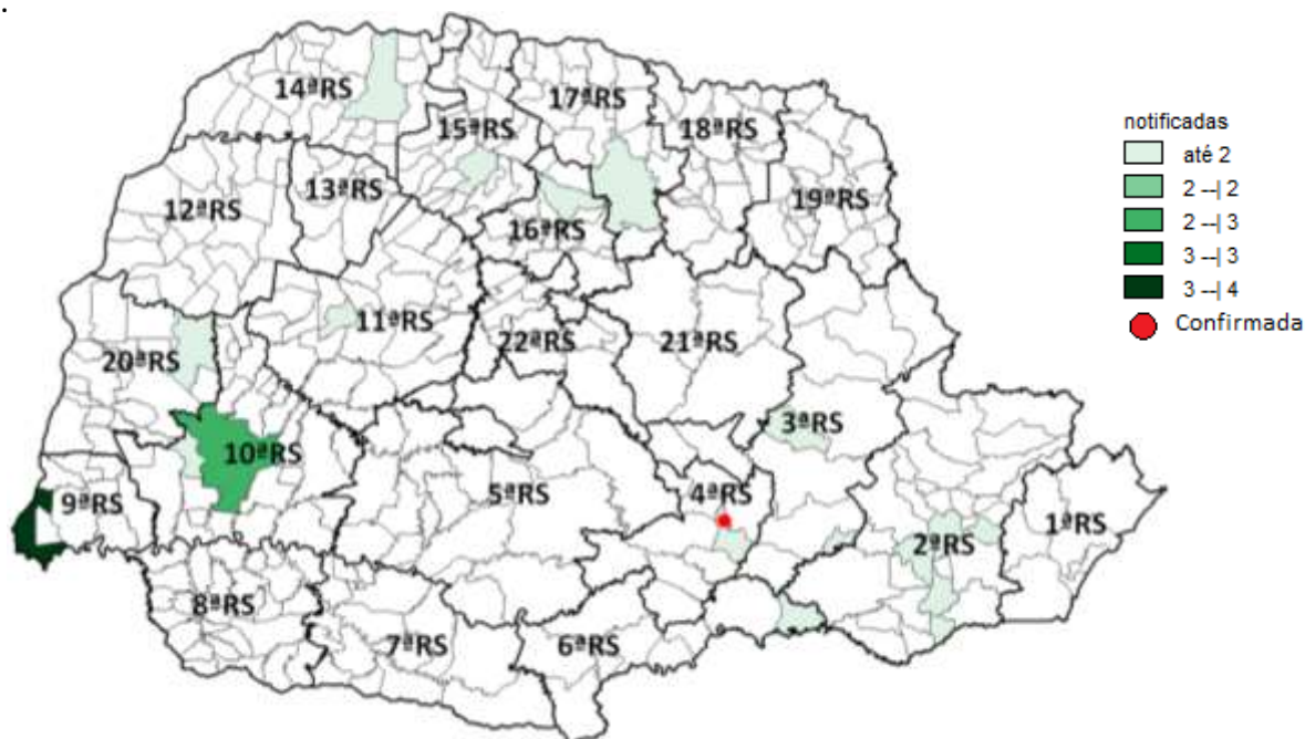
Figura 1: Epizootias notificadas e confirmadas em PNH, segundo local de ocorrência, Paraná, 01/07/2022 a 16/12/2022.